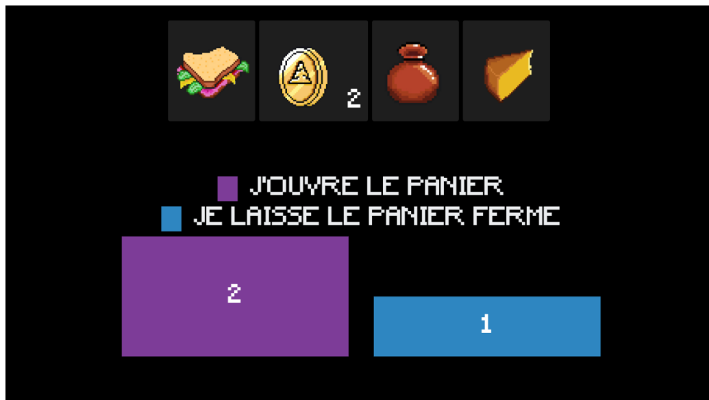
Ecran sur scène

Contact artistique : Guillaume Alix 06.79.72.65.91 / contact@guillaumealix.fr / www.guillaumealix.fr