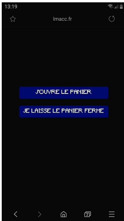
Smartphone public avant le vote