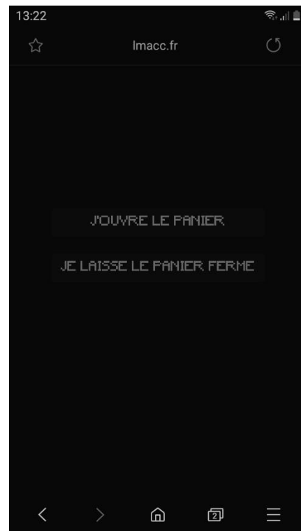
Smartphone public après le vote